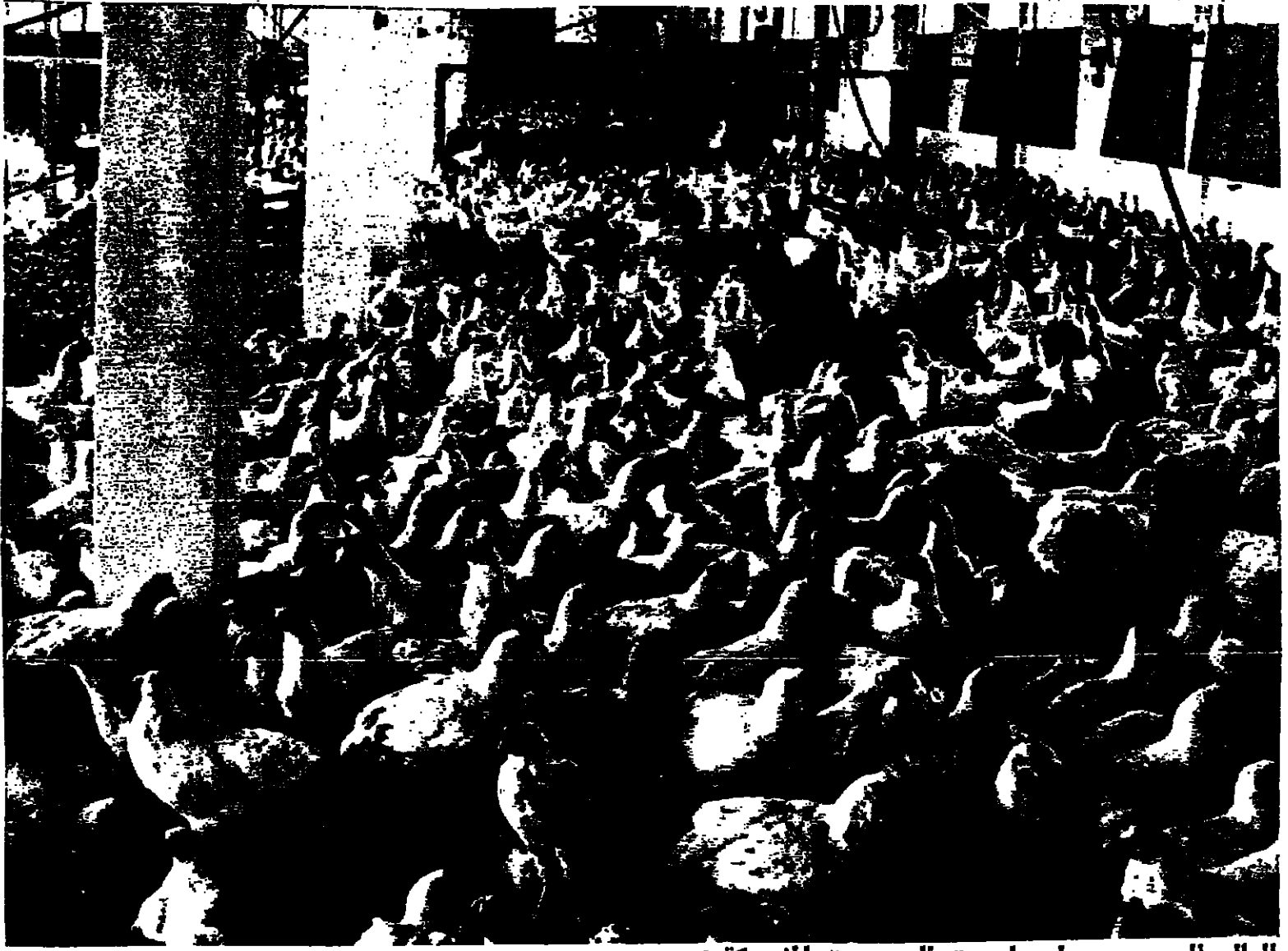
العالم العربي على طريق السوق المشتركة